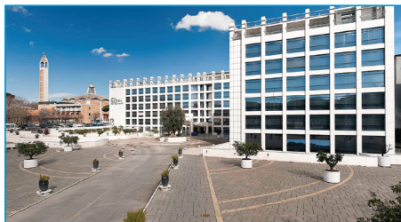
Hotel Barceló Aran Mantegna ★★★★★ Via Andrea Mantegna, 130 - 00147 Roma RM