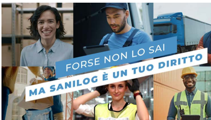
Video promozionale trasmesso in TV