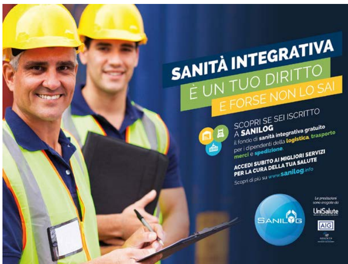
Stampa cartacea e on line